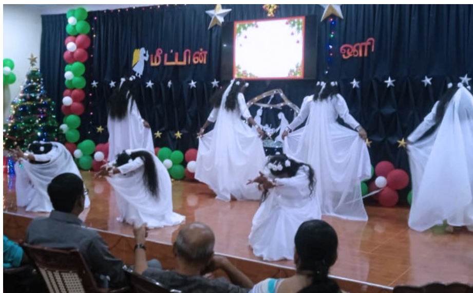
Dansande änglar på julfesten på Elim

I början av december var det den traditionella julfesten på Elim. En riktigt fin julfest ordnas för alla barn innan några åker hem till släkten över jullovet medan några är kvar och firar julen på Elim.